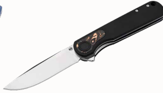
Magnum Braddock Black mit Flipper und Clip ■ 23254-05