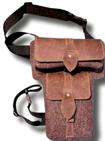
Beintasche aus Wollfilz mit Leder kombiniert mit 2 Taschen, 20x8x6 cm und 13x17x6 cm, mit herausnehmbarem, wasserabweisenden Einsatz (z.B. für Hundefutter) ■ 32303-04