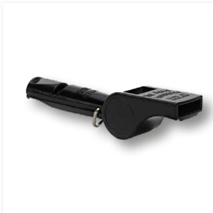
Kombinierte Hundepfeife 642 ■ 35310-10