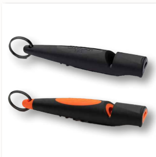
Hundepfeife 211.5 ■ 35310-30 schwarz ■ 35310-31 schwarz/orange