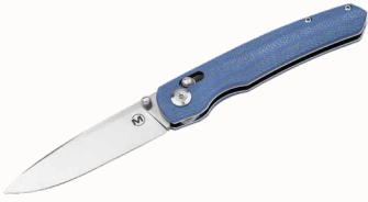
Magnum Shango mit Daumenpin und Clip ■ 23254-01