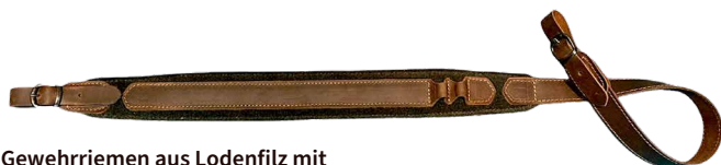
Gewehrriemen aus Lodenfilz mit Leder kombiniert mit rutschfesten Noppen, 55 mm breit ■ 32225-82