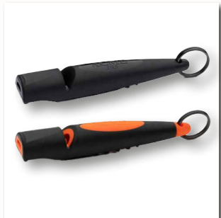
Hundepfeife 210.5 ■ 35310-20 schwarz ■ 35310-21 schwarz/orange