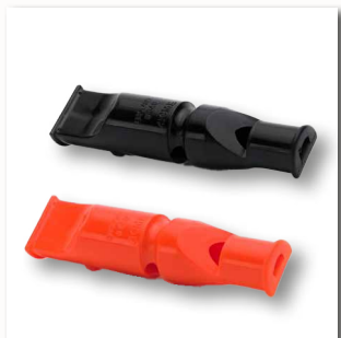
Down-Doppelpfeife 640 ■ 35310-50 schwarz ■ 35310-51 orange