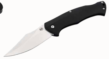
Magnum Echidna mit Nylonetui ■ 23254-17