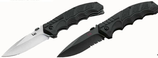
Heckler&Koch SFP Tactical Folder mit Daumenpin, Clip und Nylonetui ■ 23258-01 ■ 23258-02 All Black