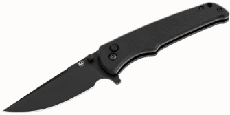
Magnum Blackjay mit Daumenpin und Clip ■ 23254-18