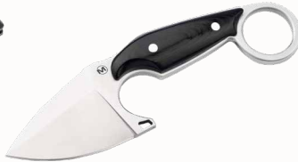
Magnum Enki mit Kydexscheide ■ 23255-36