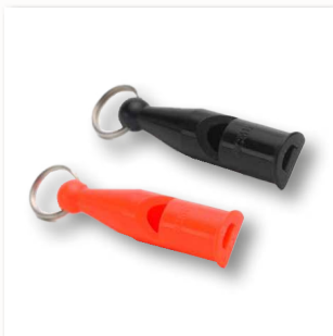
Hundepfeife 212 ■ 35310-40 schwarz ■ 35310-41 orange