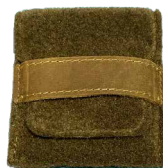
Patronenetui aus Lodenfilz mit Leder für 5 Kugelpatronen ■ 32375-58