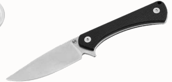
Magnum Brasa mit Kydexscheide ■ 23255-37