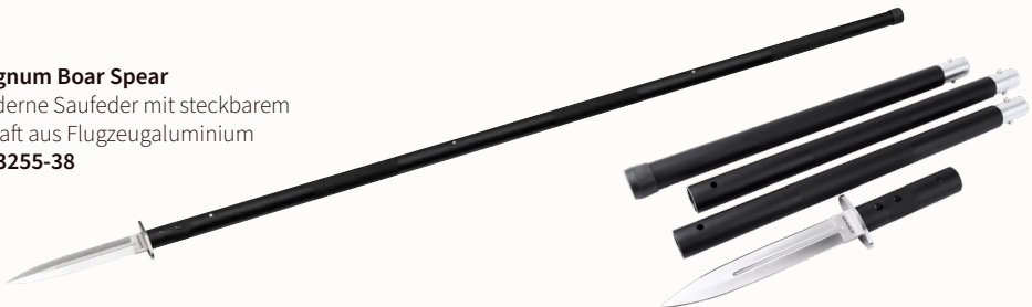
Magnum Boar Spear Moderne Saufeder mit steckbarem Schaft aus Flugzeugaluminium ■ 23255-38