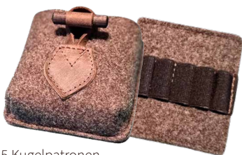
Patronenetui aus Wollfilz, Rückseite Leder für 5 Kugelpatronen, mit zusätzlicher Einlage mit 5 Kugelpatronen ■ 32375-56