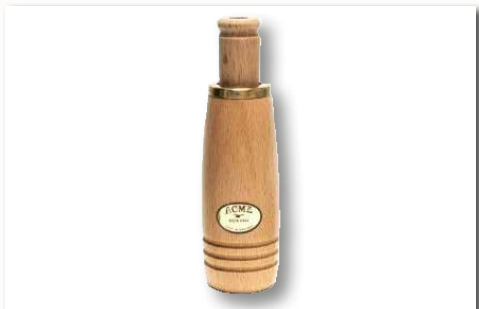
Entenlocker 570 ■ 33332-71