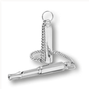
Lautlose Hundepfeife 535 vernickelt ■ 35310-60