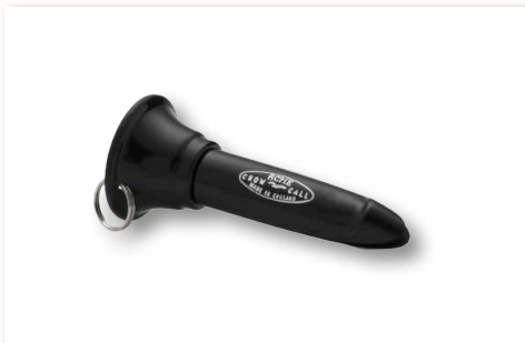
Krähenlocker 259 ■ 33332-70