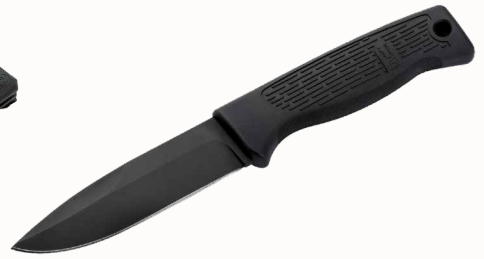
Heckler&Koch MP7 Personal Duty Knife mit Kydexscheide ■ 23258-03